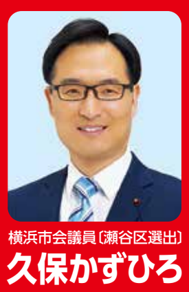
横浜市議員(瀬谷区選出) 久保かずひろ