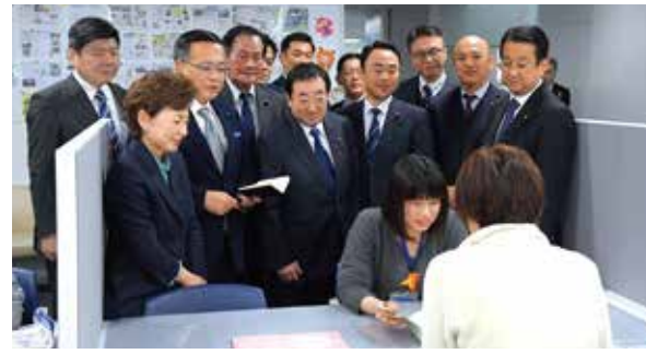
母子保健コーディネーターによる相談支援を視察

母子保健コーディネーターを全区配置！ 公明党市議団は、妊娠前から子育て期における切れ目のない支援を図る、「子育て世代包括支援センター」の機能充実を訴えて参りました。 その中でも、母子健康手帳交付時の面接・相談や、個々の状況に適した情報提供等を実施し、産前産後の支援の充実を図る母子保健コーディネーターの配置拡充を要望していましたが、令和2年度予算案に新規7区含む全18区への配置を盛り込むことができました。