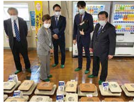
市立老松中学校を視察

選択制デリバリー方式の横浜型給食は、当日注文やカード払いも可能で、生徒の声をメニュー化するなど、他都市にない新しいスタイルの給食となりました。献立作成や衛生管理なども横浜市が直接行い、地産食材の活用などで国産比率を高めました。育ち盛りの子ども達のために、食育と栄養面に優れ、安心・安全で質の高い給食が提供されます。